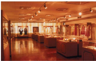
羅光總主教收藏館

中國天主教文物館是目前全臺唯一專業的天主教文物館，成立於1988年2月，並於1990年擴建；共分三個主題館：「于斌樞機紀念館」、「中國天主教會館」、「羅光總主教收藏館」。館藏包括中國天主教相關重要史料及藝術文物，詳盡介紹四百年來，中國天主教發展歷史、儀式用品，充分呈現天主教精髓所在。本館為輔仁大學特色，天主教文物收藏之重地。